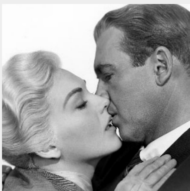
Madeleine és Scottie, Alfred Hitchcock, Szédülés (1958)

A döntés a leugrásról már a korlát átmászása előtt megszületik, és levélben megfogalmazódik. Maga az ugrás már egy öntudatlan, kiszolgáltatott, szédült állapotban történik, hiszen az én már nem az én. De akkor vajon ki vagy mi irányítja a megszedült mozgását?