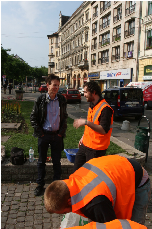
egy kíváncsi lakó