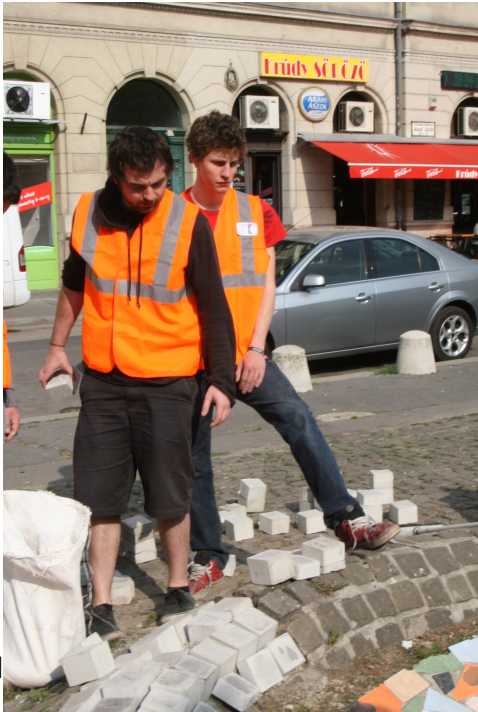
lassan minden a helyére kerül