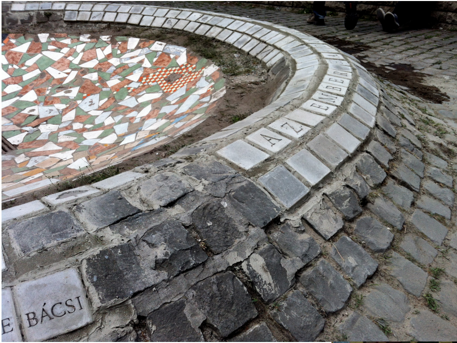
a kész kút