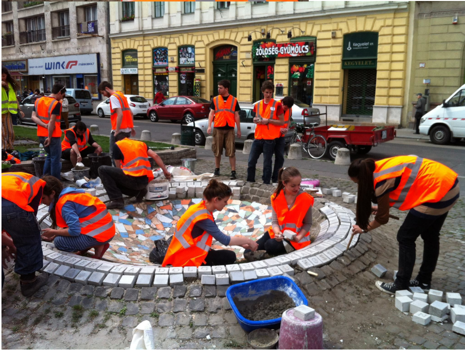
a munka teljes lendülettel