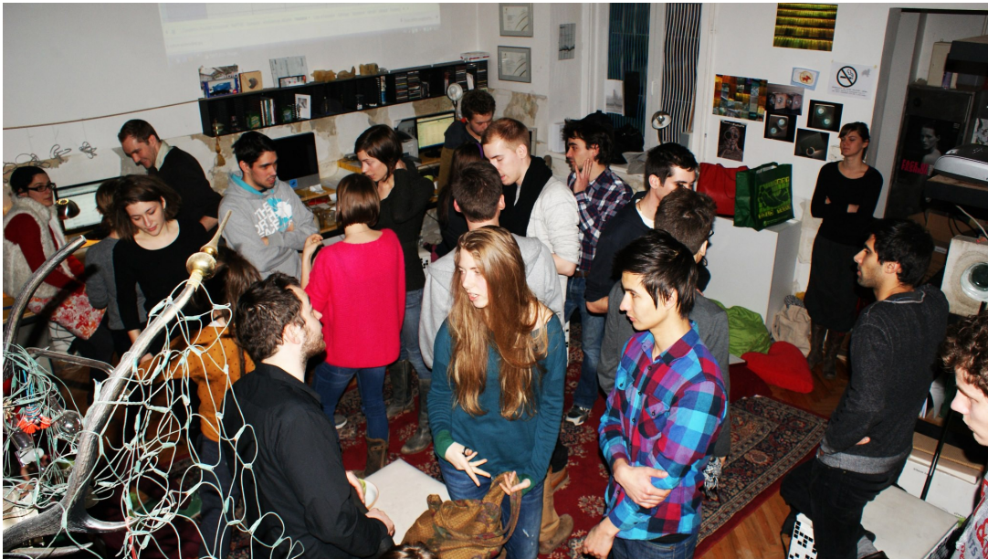
a közösségi gondolkodás