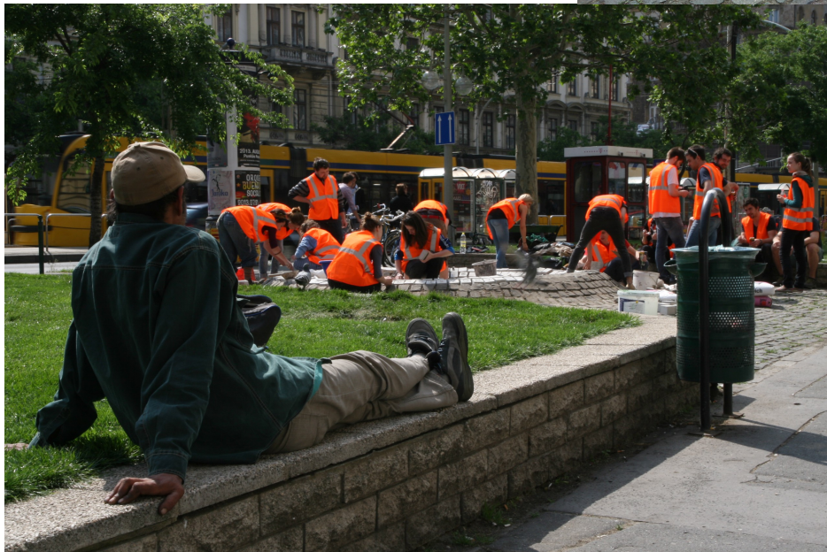
a váratlan hír