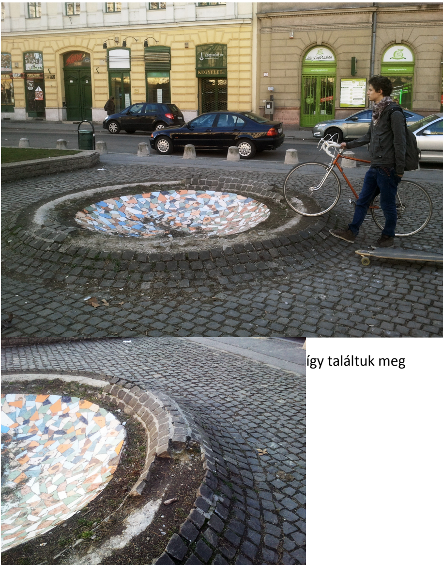
így találtuk meg