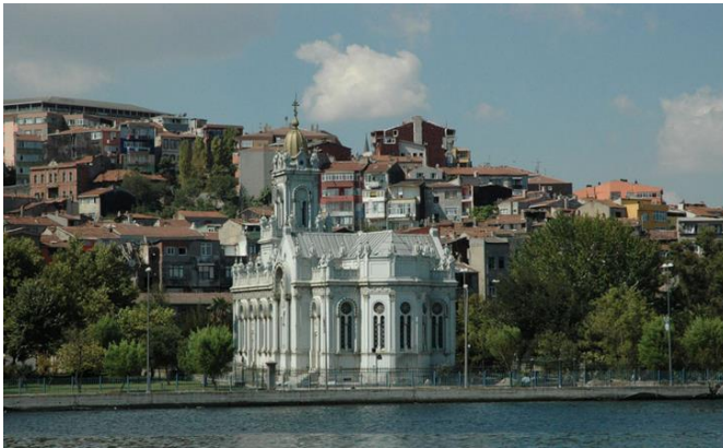
5. ábra A Sveti Stefan templom

információk szerint – egyetlen fennmaradt tisztán acélszerkezetű temploma török forrásokból (Isztambul költségvetéséből, bolgár segítséggel) eredeti formájában újult meg 17 . A Sveti