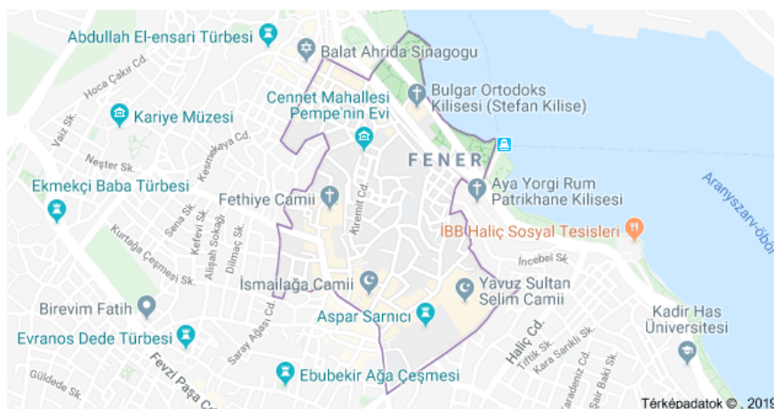
1. ábra Balat elhelyezkedése

Balat Isztambul egyik legrégebbi kerülete, Fener és Ayyansaray között helyezkedik el. 2 Helyzete sok tekintetben ellentmondásos. Elhelyezkedése ideálisnak mondható: közvetlen az Aranyszarv-öböl partján, Isztambul legfrekvenciáltabb részeitől sétatávolságra található. Ezzel együtt, a mai napig „gettónak” számít; bár az elmúlt években a városrész igen dinamikus változást élhetett meg.