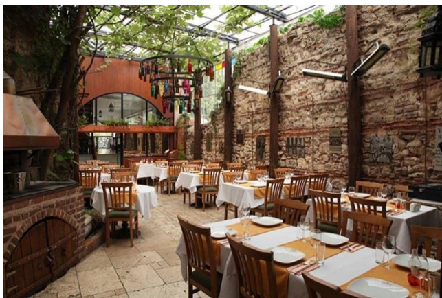
4. ábra https://istanbul.com/agora-myhanesi-1890

mivel nem ment keresztül a városi átalakuláson. 10 Dindar elkötelezett a helyi közösség bevonása iránt is, rendszeresen szervez közösségi eseményeket, melyeken megpróbálja a helyiek közül az érdeklődőket megszólítani-megnyerni ennek a felfogásnak, egyben elérni, hogy minél magasabb nivójú helyi közösség alakuljon ki. Ersin Kalkan újságíró, aki itt