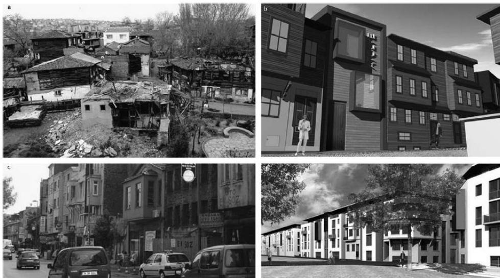
3. ábra A régi és az új: Balat a múltban és a tervekben. Forrás: Zeynep Gunay- Vedia Dokmeci, Culture-led regeneration of Istanbul waterfront: Golden Horn Cultural Valley Project , 2017.o.

számú kormányhatározattal állami tervpályázatot írtak ki a területre, melyet a Çalik Holdinghoz kapcsolt GAP Construction 2007-ben nyert meg. Ez a terv azonban nem számolt a helyi érdekekkel – a cél a megőrzésről az átalakításra helyeződött. Ennek során igen komoly bontási munkálatok kezdődtek; a bontás több ezer ingatlant érintett volna. Ebben pedig igen nagy területeken nem megújítás-rehabilitáció, hanem a „kinyert” üres területek üzleti célú hasznosítása szerepelt célként, akár a „régit” csak szimbolikusan használó, illetve egészében modern elemek beépítésével.