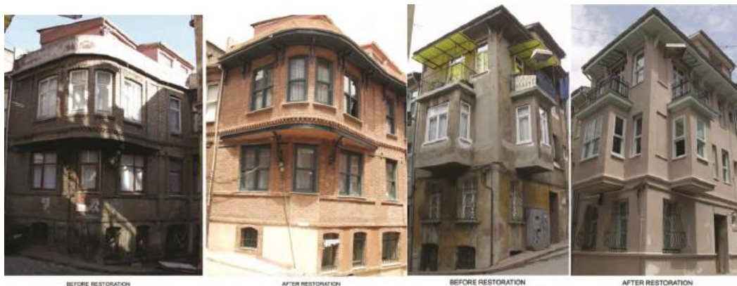
2. ábra A felújítás jellege; forrás: Elmira Gur (2015): Regeneration of the historical urban center and changing housing market dynamics: 'Fener-Balat', International Journal of Architectural Research 2015/March 9(1):239

Az Unió 7 millió eurós forrást biztosított a rehabilitációra, ennek során azonban szigorú és a helyiek számára nehezen vállalható feltételeket kívánt érvényesíteni. Ennek során előfordult kisajátítás-kilakoltatás is, illetve a felújításért „cserébe” eladási moratóriumot hirdettek. Ez a projekt nem nyerte meg a tetszését sem a helyi lakosoknak, sem a befektetőknek. Ennek megfelelően a projekt – nem kis részben a jelentősen elszálló költségek okán – kisebb számú épület rehabilitációjára, nagyobb számú épület minimális értékvédelmére korlátozódott és pár év alatt lezárult (pontosabb talán úgy fogalmazni, hogy érdeklődés és forrás hiányában kifulladt).